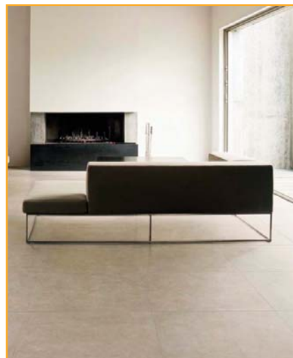
IRIS CERAMICHE: Esempio di pavimentazione prevista realizzata con la collezione Idea Casa.

Per la pavimentazione degli appartamenti e per i rivestimenti del bagno principale, Fidia Vi propone la collezione Idea Casa della IRIS CERAMICHE, un prodotto in grès porcellanato di prima scelta , posto con disegno ortogonale o diagonale. Idea Casa è una linea che si ispira alla tradizione, con soluzioni raffinate e di prestigio, un prodotto creato per chi predilige uno stile sobrio ed elegante, mantenendo tutta la classe e la qualità della IRIS CERAMICHE.