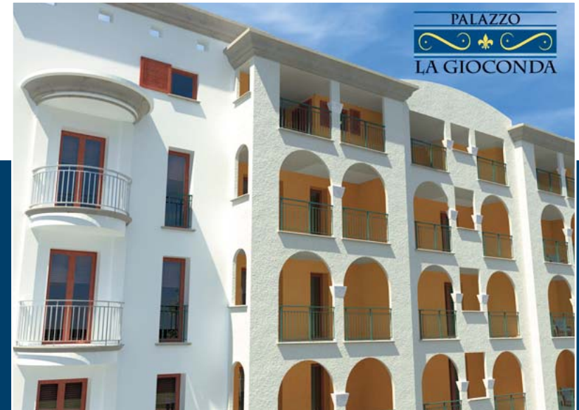
PALAZZO LA GIOCONDA VIA ATERNO PESCARA OVEST