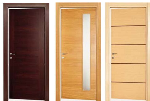
Alcuni esempi di porte della PAIL. Da sinistra: wengé, rovere con vetro laterale, multirovere sbiancato e a destra la porta in ciliegio.

Le serie proposte sono: LINEA, ANTEA, MARSIA e INFINITA, linee di porte che offrono una vasta gamma di prodotti in grado di soddisfare qualsiasi gusto e tipologia di stile di arredamento; numerose sono le essenze fra le quali scegliere la giusta armonia di eleganza e modernità per ogni ambiente.