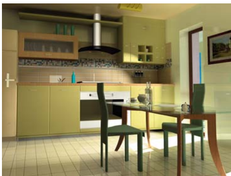
Studio per gli interni degli appartamenti: rendering 3D realizzati da Fidia Communication

Impianti forniti: TV, satellitare, predisposizione digitale terrestre, telefonico, videocitofono, cancello elettrico di accesso pedonale e cancello carrabile telecomandato, lampada di emergenza portatile. Predisposizione impianto di climatizzazione interno e predisposizione per l'impianto a pannelli solari.