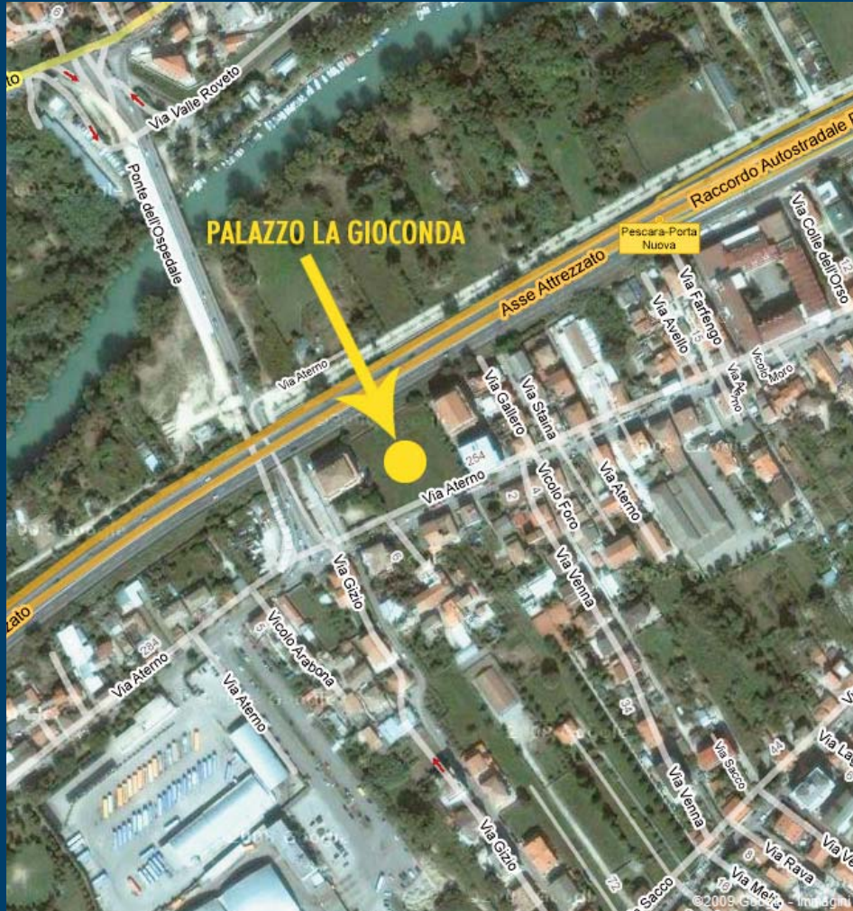
PALAZZO LA GIOCONDA VIA ATERNO zona PESCARA OVEST