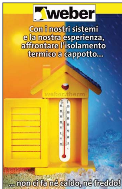
Depliant del prodotto della Weber: sistema d'isolamento termoacustico a cappotto.

Per ottenere un perfetto isolamento termoacustico sarà utilizzato un sistema differenziato nei vari componenti costruttivi. Per l'isolamento termoacustico delle tamponature esterne sarà utilizzato un sistema multistrato molto compatto,